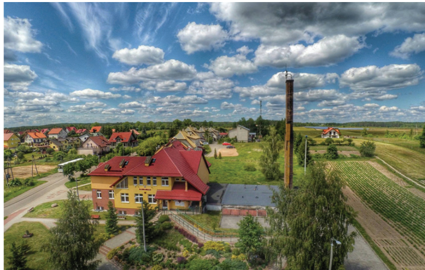
Jedwabno z „lotu ptaka”.

23. Powoli drzewa zaczynają ustępować miejsca łąkom i pastwiskom.