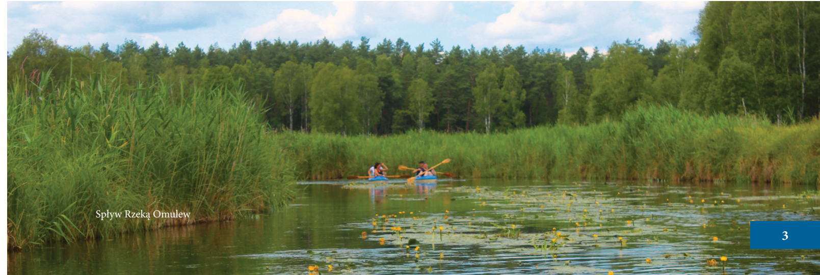
Spływ Rzeką Omulew

licznych lasach (np. do Rezerwatu przyrody Małga ze zniszczoną wsią w której zachowała się wieża z czerwonej cegły i ewangelicki cmentarz), wybrać się na spływ kajakowy lub nad któreś z wielu, gminnych jezior czy do Stajni w Napiwodzie.