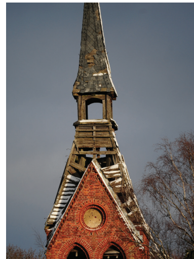
Małga, wieża kościelna

malowniczo położona wieża kościelna i cmentarz oraz relikty fundamentów domów mieszkalnych. W odległości 1,5 km od prawego brzegu ruin zabudowań