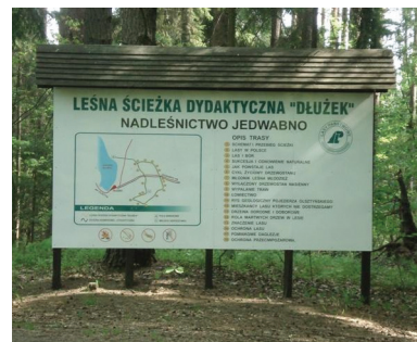
Ścieżka dydaktyczna „Dłużek”

two zorientować się w terenie. W połowie długości szlak przecina się z Leśną Ścieżką Dydaktyczną „Dłużek”, utworzoną na dawnym pasie przeciwpożarowym i otoczoną urozmaiconym lasem. Po drodze można zobaczyć pomnikowe dąglezje, różne gatunki drzew leśnych, drzewostan nasienny, paśniki dla dzików i jeleni. Ponadto Nadleśnictwa