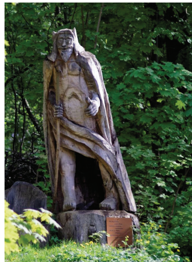
Dłużek, rzeźba Smętka

Jedwabno ulokowało na ścieżce 18 tablic edukacyjnych na których znajdują się różnorodne informacje, a także ławki, które zachęcają do odpoczynku w cieniu