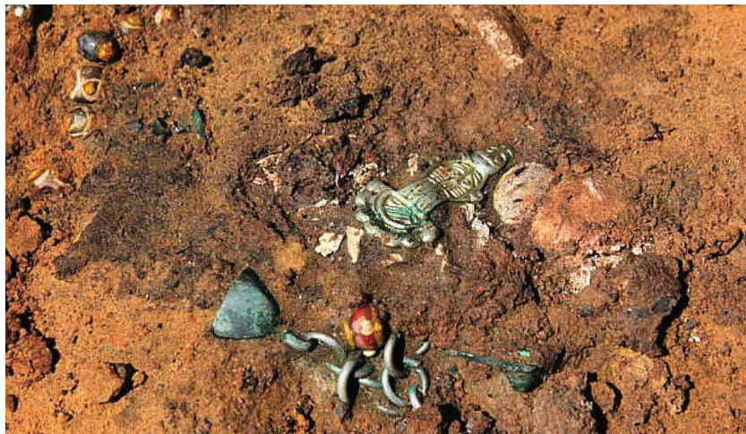
Burdąg, jeden z grobów ciałopalnych z widocznymi elementami wyposażenia.

T rasy które zostały przedstawione to wspaniała propozycja na spędzenie wolnego czasu