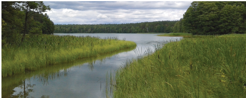
Wypływ rzeki Omulew

my się na wschód jeziora Omulew. 2. Mijamy niewielką wyspę Ostrów, która stanowi miejsce gniazdowania czapli siwych i kormoranów. 3. Przez cieśninę kierujemy się na południe do kolejnej zatoki jeziora. 4. Po lewej stronie znajdujemy wypływ rzeki Omulew. Liczne śla-