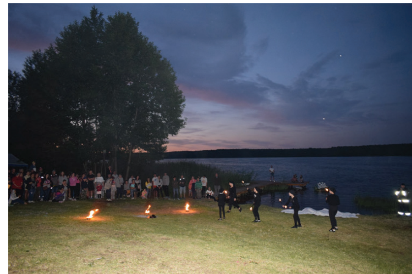
Jezioro Małszewskie i występ grupy teatralno- ogniowej „Zakręceni”

książki „ Wyspy szczęśliwe” Wioletty Sawickiej. Ścieżka rowerowa prowadzi przez las głównie sosnowy, bardzo przejrzysty i obfi-