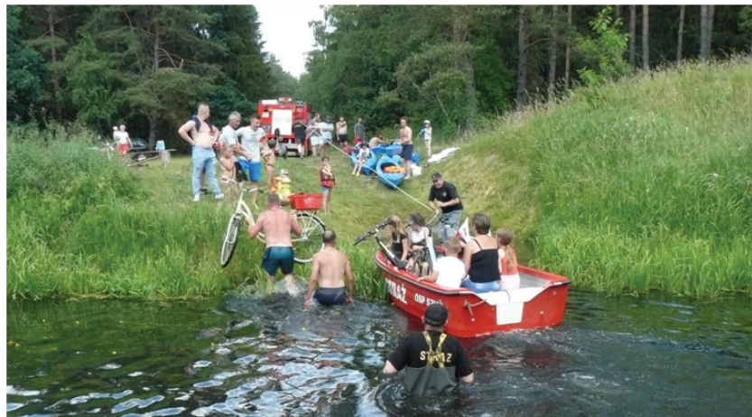
Aktywnie w sołectwie Szuć

niegdyś jezior jest pochodzenia staropruskiego. Ciekawostkami są tu pozostałości po nieistniejących już wioskach: Dębowiec Mały, Dębowiec Duży i Ruda, a także pobliski rezerwat przyrody Małga położone nad szlakiem