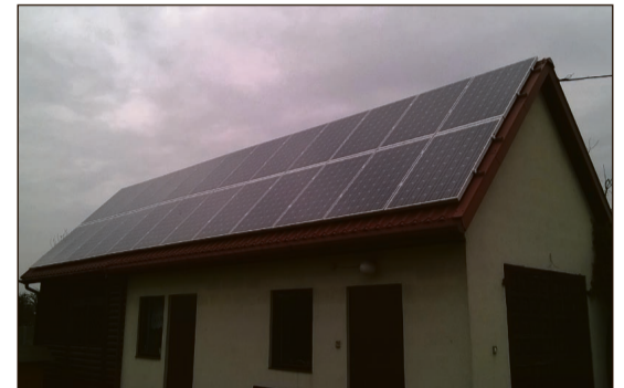
Panele słoneczne