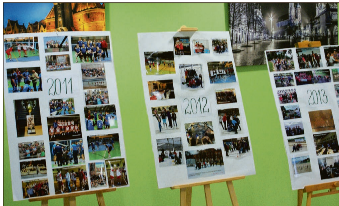
Wystawę fotograficzną nt. 10-lecia Ren Butu można oglądać w hali „Tęcza”